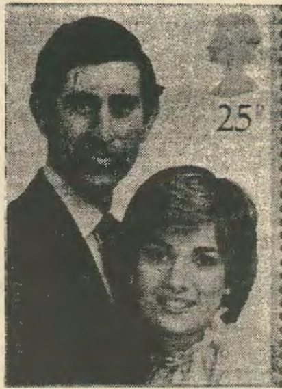
Μια δεκαπεντάλεπτη έγχρωμη ταινία με στιγμιότυπα απο τον γάμο του πρίγκηπα Καρόλου και της Νταϊάνα θα μεταδοθεί στις 29 Ιουλίου απο το «δελτίο ειδήσεων» των 8.30 μ.μ.

Ως εδώ καλά απο την γηραιά αστική Αγγλία. Στην Κύπρο όμως γιατί οι υπεύθυνοι του ΡΙΚ προβάλλουν αυτή την δεκαπεντάλεπτη ταινία την ώρα του δελτίου ειδήσεων που θεωρείται η πιο σπουδαία ώρα της τηλε-